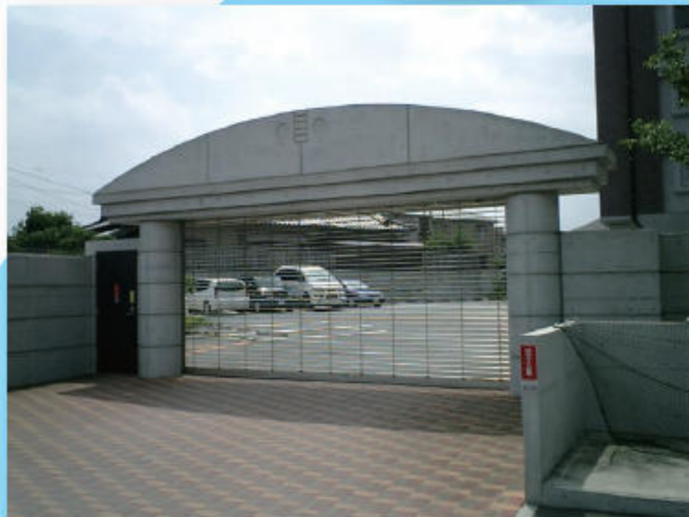
シャッターゲート付駐車場

採用しクオリティの高い防犯対策を備えました。 駐車場の出入り口はシャッターゲートを