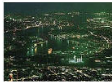
皿倉山からの夜景