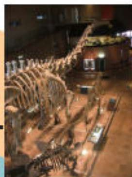
いのちのたび博物館