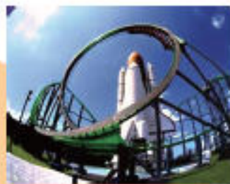
スペースワールド